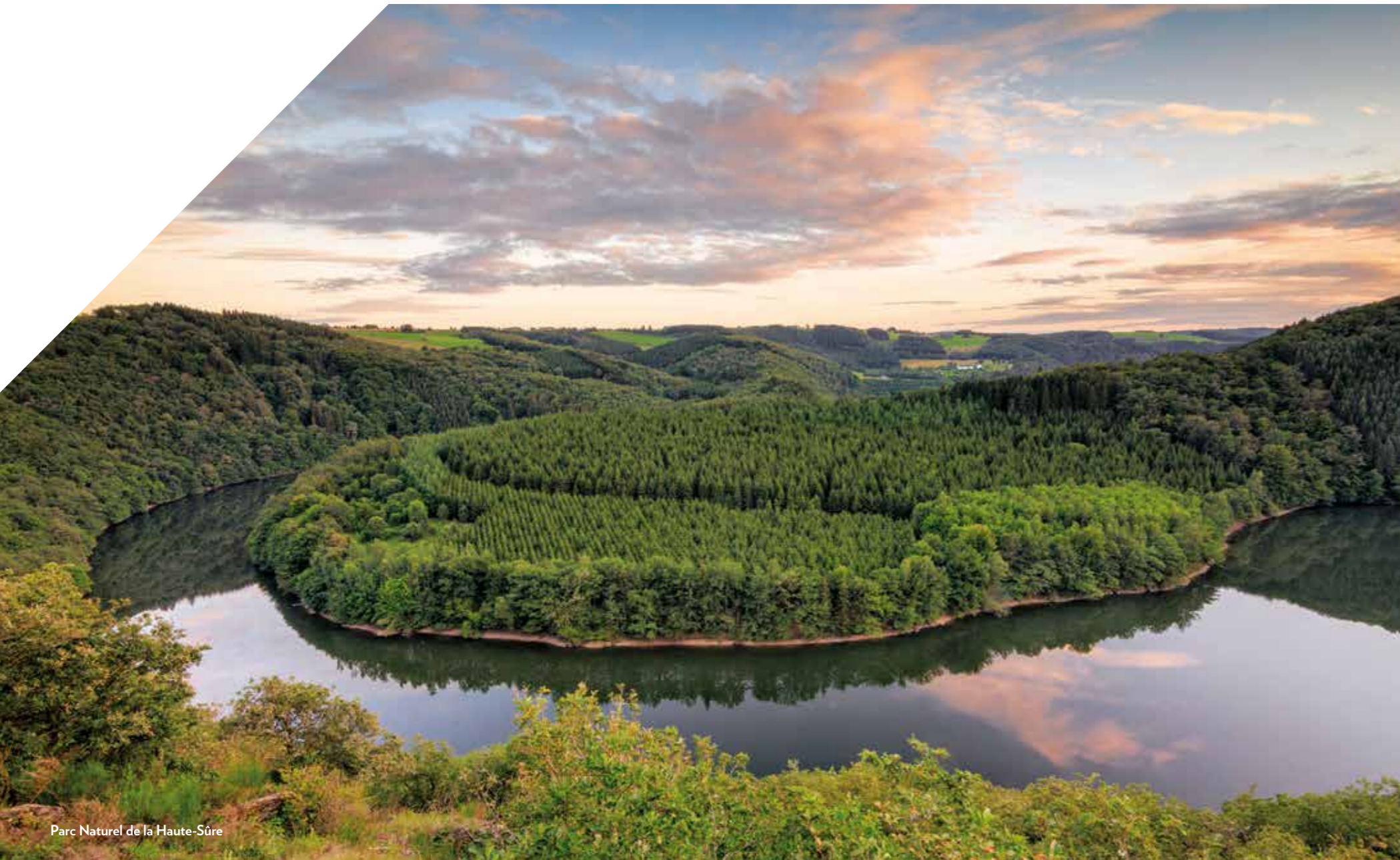
Parc Naturel de la Haute-Sûre