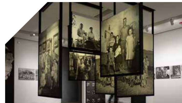
Clervaux, The Family of Man