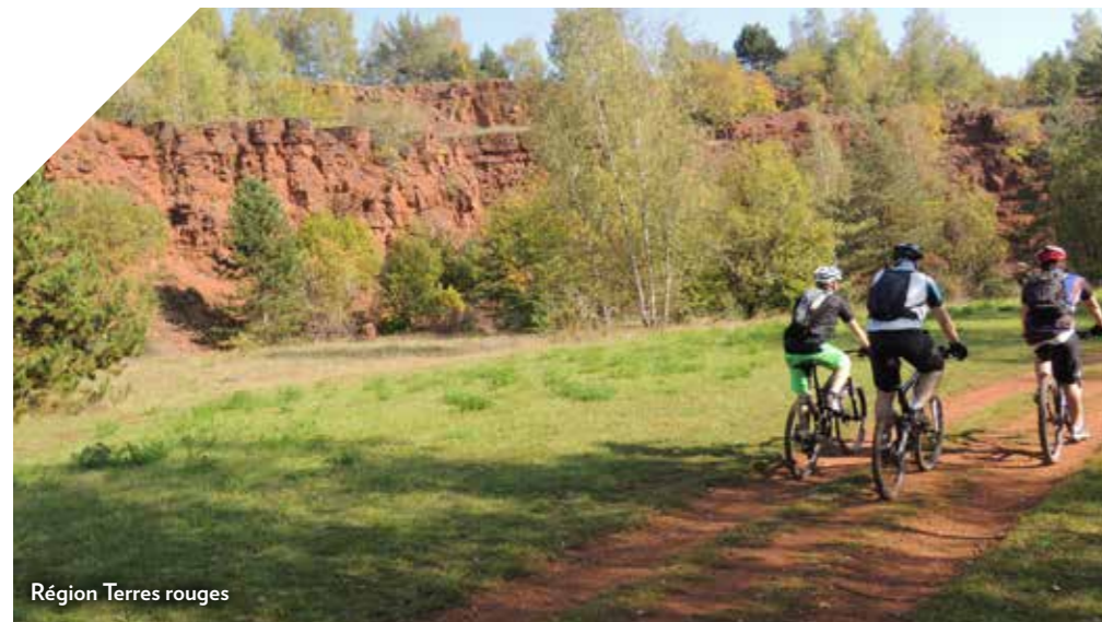
Région Terres rouges

Between plains and woods, with lakes and rivers, Luxembourg's landscapes are enchanting as well as fascinating. Nature in Luxembourg also means to discover unexpectedly a picturesque village, a mysterious ruin or just a breathtaking landscape behind every turn. Rock formations, meandering streams or colourful flora - nature in Luxembourg still knows some untouched spots by mankind. Between family tours, hiking or romantic excursions, Luxembourg has plenty of natural space waiting to be discovered, the whole year through.