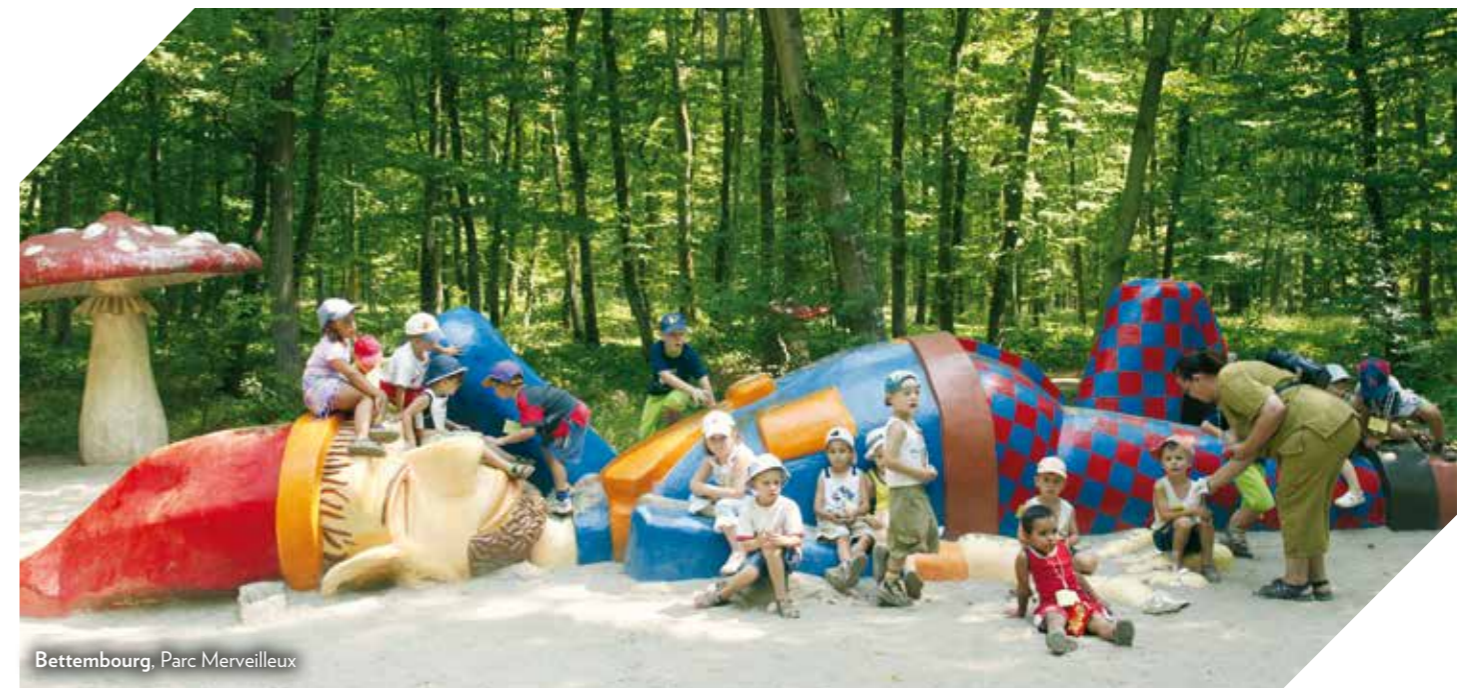
Bettembourg, Parc Merveilleux

The choice is enormous! Scattered upon its 2,586 km 2 , Luxembourg offers a multitude of leisure activities for children of all ages. From city trains to chairlifts, from climbing parks to the exploration of former mine shafts, activities with children and youngsters become a great adventure. Many leisure activities for children are offered throughout the year, regardless of the weather. One of Luxembourg's great talents consists in touristic offers that perfectly combine didactic effects with fun and action. For example, children can participate in instructive workshops and learn respectful relationship with nature.