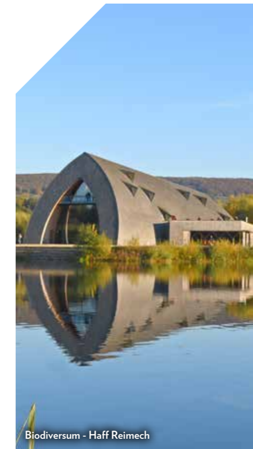
Biodiversum - Haff Reimech