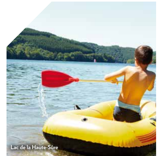
Lac de la Haute-Sûre