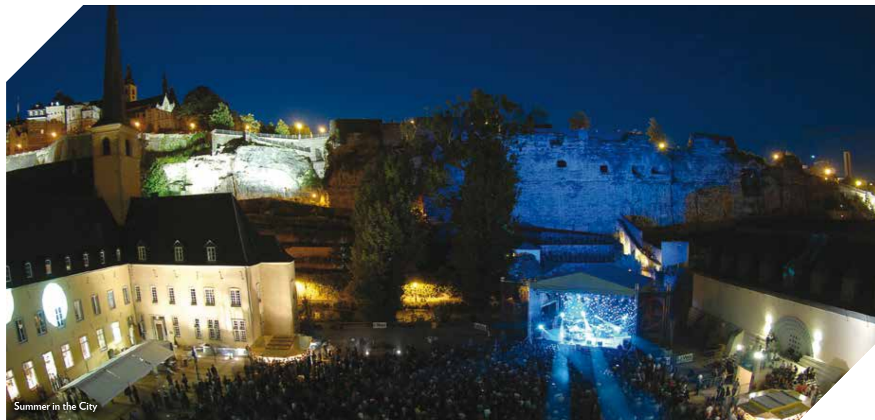
Summer in the City