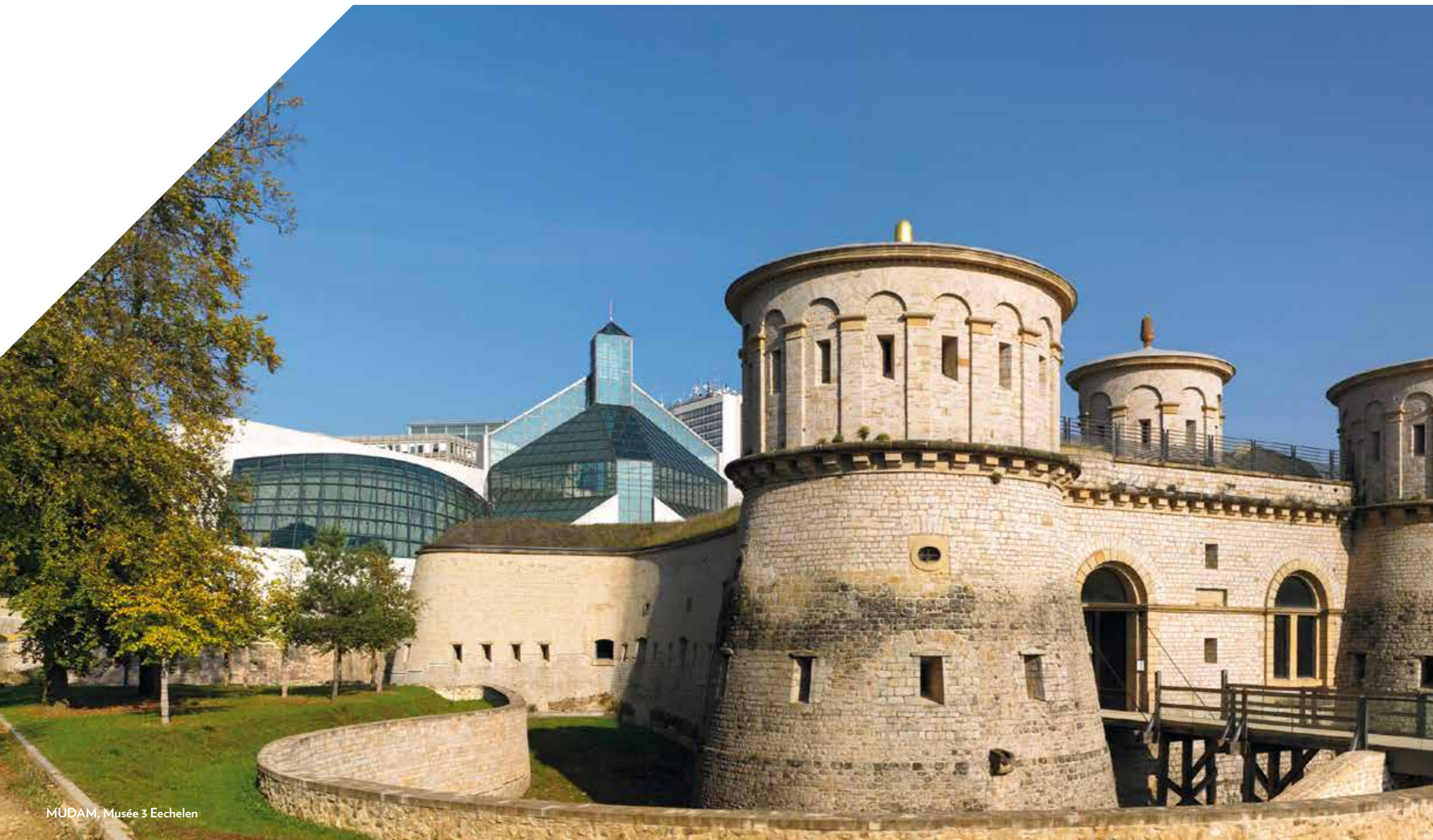
MUDAM, Musée 3 Eechelen