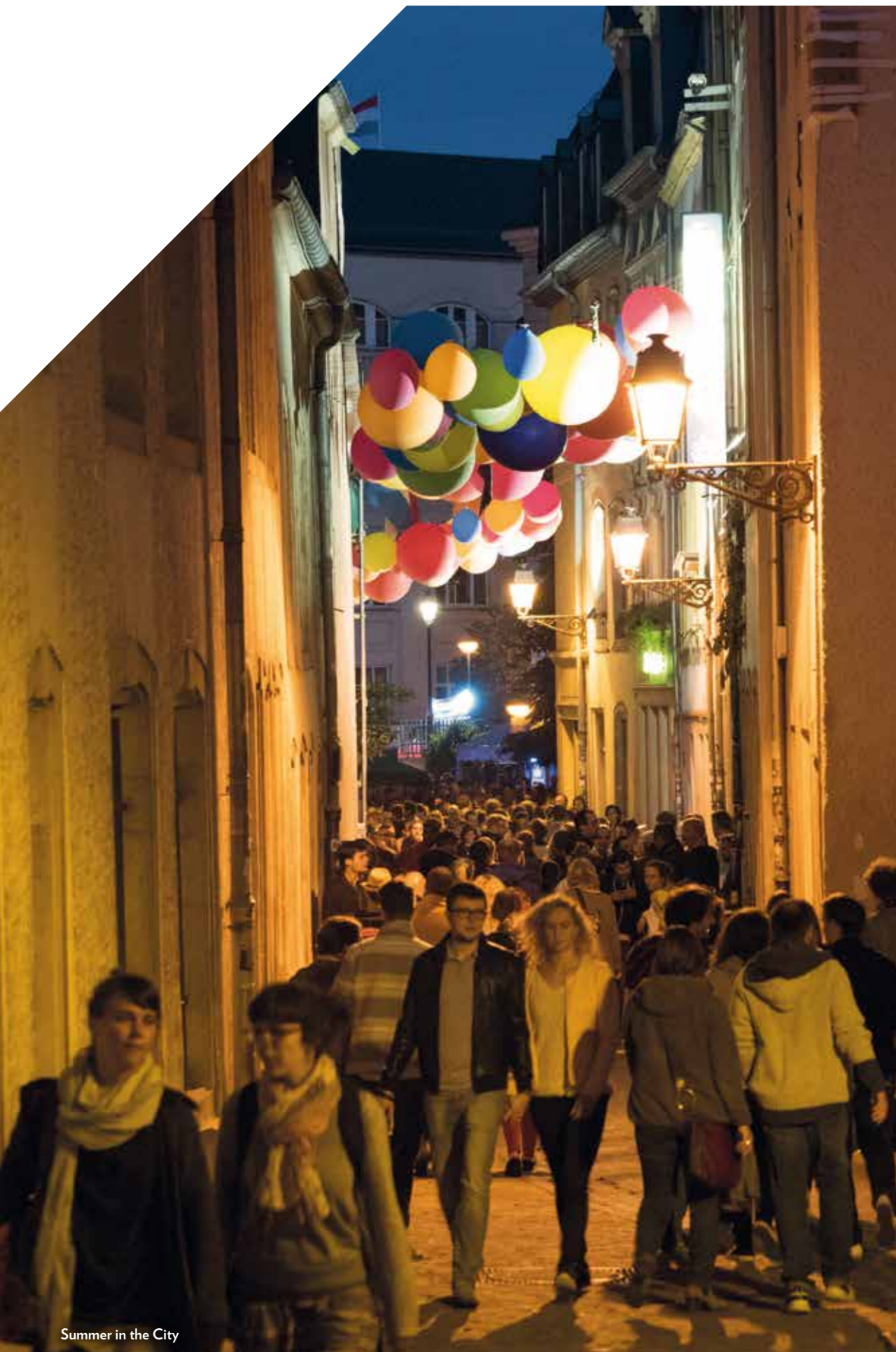
Summer in the City