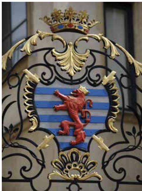
大公宮殿の紋章

この紋章は1972年6月23日付の国章法で法的に保護されており、さらに1993年7月27日の法律で、同法の改正と補遺が行われました。