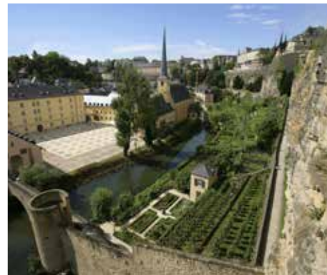
グルント

ロンドン条約でその地位を保証されたにもかかわらず、第一次大戦が勃発した1914年、ルクセンブルクはドイツの侵攻を受け、軍事的に占拠されます。ルクセンブルク政府はドイツの侵攻に激しく抗議しながらも、紛争当事者に対する絶対的な中立性を示しました。マリー・アデライード女大公と政府は権力の座にとどまり続けましたが、このことが第一次世界大戦後に政治的な影響を及ぼすことになります。