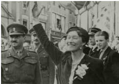
シャルロット女大公(1944年)

ルクセンブルクは1930年代、中立的な立場を維持しながら、ジュネーブに本部を置く国際連盟で積極的に役割を担い、国際社会における地位を堅固なものにしていきました。