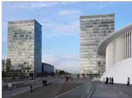
キルシュベルク地区

人口の45.3%が外国人居住者であるルクセンブルクは、開放的な国家のモデルであり、ヨーロッパの縮図と見なされています。小規模だからこそ、人間味のある調和のとれた国というイメージを保つことができているのです。