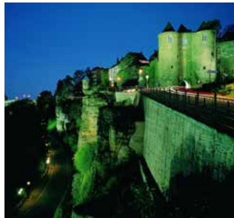
首都に残る古い要塞群

1830年、ベルギー革命が勃発した時、ルクセンブルク国民の一部はベルギーの革命派に同調してギヨーム1世の政策に対する不満を表しました。その後、列強は1831年にベルギー王国を設立して、ベルギーとオランダを分離させます。