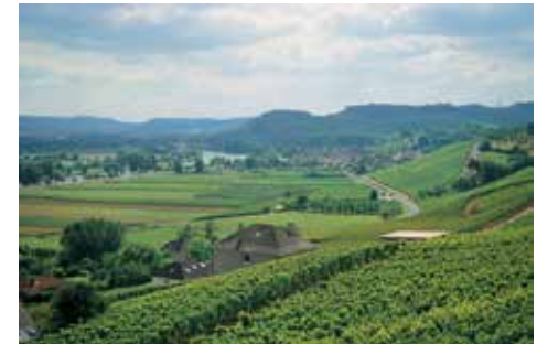
La région de la Moselle : sa rivière et ses vignobles