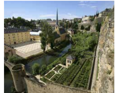
Quartier du Grund

Les garanties accordées par le traité de Londres n'empêchent cependant pas l'invasion du Luxembourg par les troupes allemandes en 1914. L'occupation est limitée au domaine militaire. Les autorités luxembourgeoises protestent contre l'invasion allemande, mais observent une stricte neutralité envers les belligérants. La Grande-Duchesse Marie-Adélaïde et le gouvernement restent en place, ce qui aura des conséquences politiques après la Première Guerre mondiale.