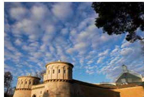
Le Musée Dräi Eechelen et le Musée d'art moderne Grand-Duc Jean à l'arrière-plan