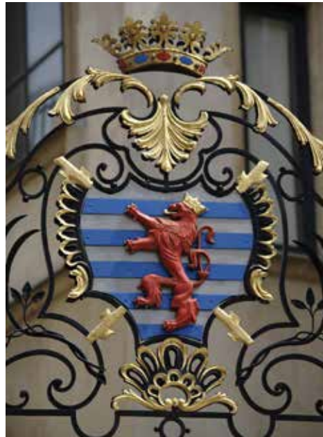
Armoiries sur le palais grand-ducal

Les armoiries sont protégées par la loi du 23 juin 1972 sur les emblèmes nationaux. La loi du 27 juillet 1993 a modifié et complété celle de 1972.