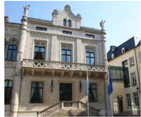
Abgeordnetenkammer © Chambre des députés

Im Hinblick auf die Gesetzgebung ist das Gutachten des Staatsrates obligatorisch für alle in die Abgeordnetenkammer eingebrachten Gesetzentwürfe