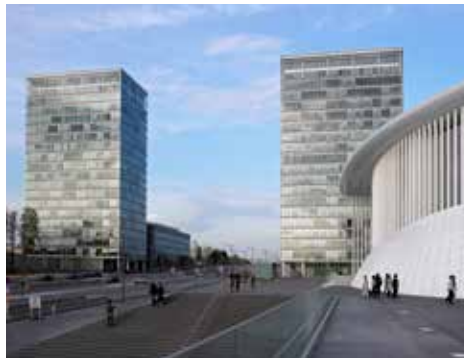
Das Stadtviertel Kirchberg

Luxemburg wird als Musterbeispiel für eine gelungene Öffnung zum Ausland angesehen und gilt mit einem Ausländeranteil von 45,3% als europäischer Mikrokosmos. Aufgrund seiner geringen Größe konnte Luxemburg das Image eines beschaulichen Landes von „menschlichen Ausmaßen“ beibehalten.