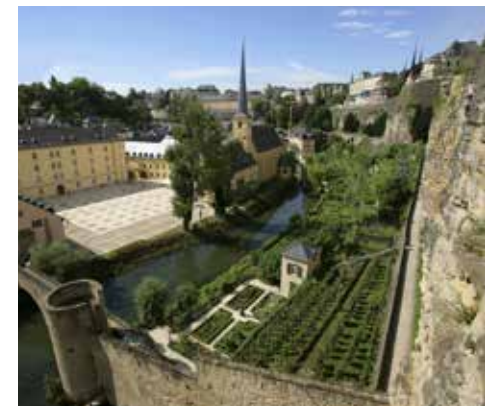
Das Stadtviertel Grund

Trotz der im Londoner Vertrag gewährten Garantien kam es 1914 zur Invasion Luxemburgs durch die deutschen Truppen. Die Besetzung beschränkte