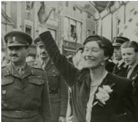
Großherzogin Charlotte 1944

Im September 1919 beschloss die Luxemburger Regierung, ein Doppelreferendum abzuhalten, bei dem es sowohl um die Staatsform (Monarchie oder Republik) als auch um die wirtschaftliche Ausrichtung des Landes nach dem Austritt aus dem Zollverein ging. Die Bevölkerung, die erstmals mit allgemeinem Wahlrecht abstimmte, sprach sich mit