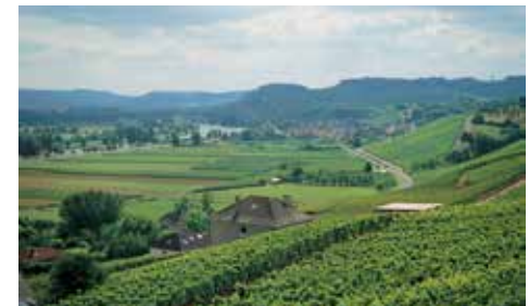
Die Moselgegend: der Fluss und die Weinberge