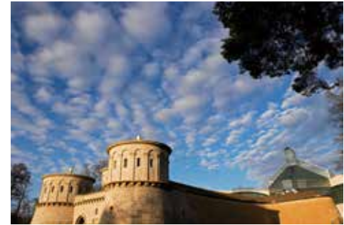
Das Musée Dräi Eechelen mit dem Musée d'art moderne Grand-Duc Jean im Hintergrund