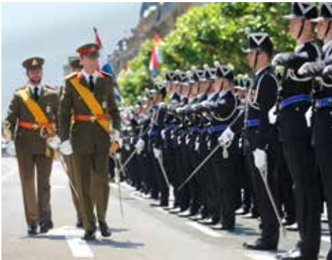
S. K.H. der Großherzog, gefolgt von seinem Sohn, dem Erbgroßherzog, am Nationalfeiertag

Der Großherzog ist das Staatsoberhaupt. Seine Person ist unantastbar, was bedeutet, dass er nicht zur Verantwortung gezogen werden kann: Er kann weder angeklagt noch gerichtlich belangt werden. Aus der Nichtverantwortlichkeit des Großherzogs ergibt sich die Verantwortlichkeit der Minister. Damit eine Handlung des Großherzogs wirksam werden kann, muss sie von einem Mitglied der Regierung gegengezeichnet werden, das dadurch die volle Verantwortung dafür übernimmt. Im Zusammenhang mit Handlungen, die direkt oder indirekt mit dem Ministeramt zusammenhängen, handelt es sich hierbei um eine allgemeine Verantwortung. Diese kann sowohl die juristische, d.h. straf- oder zivilrechtliche Verantwortung als auch die politische Verantwortung umfassen. Grundsätzlich muss jede Handlung, für die der Großherzog eine Unterschrift geleistet hat, dem Regierungsrat vorher zur Beratung vorgelegt worden sein.