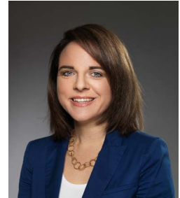
Ministère fir Famill, Integratioun an d'Grossregioun 12-14, avenue Emile Reuter L-2420 Luxembourg Tel.: (+352) 247-86500 Fax: (+352) 247-86570 Site: mfamigr.gouvernement.lu

Am Kader vun hirem Studium sammelt d'Corinne Cahen berufflech Erfahrung als Journalistin, ënner anerem bei RTL Hei Elei Kuck Elei (haut RTL Télé Lëtzebuerg), beim Eldorado, beim regionale Radiosender Nice-Côte d'Azur, bei Radio France Internationale a bei der Agence France-Presse.