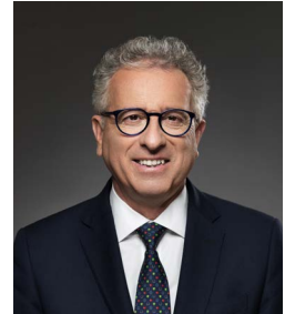
Ministerium der Finanzen 3, rue de la Congrégation L-1352 Luxembourg Tel.: (+352) 247-82600 Fax: (+352) 47 52 41 Webseite: mfin.gouvernement.lu

Pierre Gramegna ist auch ein Förderer der Diversifizierung von Luxemburgs Finanzplatz, insbesondere im Hinblick auf Fintech und nachhaltige Finanzwirtschaft. Er war Initiator und Vorsitzender der LHoFT-Stiftung, welche das Luxembourg House of Financial Technology betreibt. Außerdem förderte er die bilaterale Beziehungen zu China in der Finanzindustrie weiter, und seit seinem Amtsantritt entschieden sich vier weitere chinesische Banken für Luxemburg als ihr EU-Zentrum.