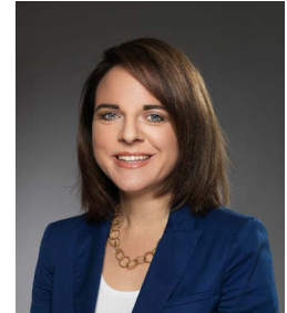
Ministerium für Familie, Integration und die Großregion 12-14, avenue Emile Reuter L-2420 Luxembourg Tel.: (+352) 247-86500 Fax: (+352) 247-86570 Webseite: mfamigr.gouvernement.lu

Während ihres Studiums sammelte Corinne Cahen bei RTL Hei Elei Kuck Elei (heute RTL Télé Lëtzebuerg), Eldorado, dem Regionalradiosender Nice-Côte d'Azur, Radio France Internationale und der Agence France-Presse Berufserfahrung im Journalismusbereich.