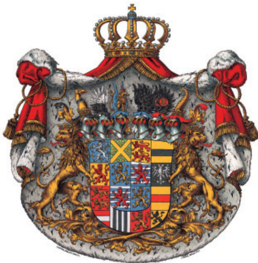
Armes composées en 1898 pour S.A.R. le Grand-Duc Adolphe de Nassau