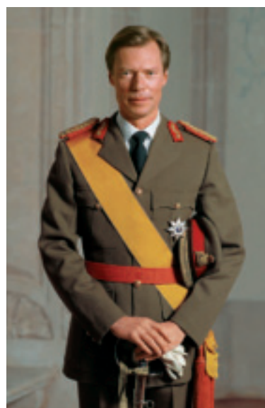
S.A.R. le Grand-Duc

Son fils Guillaume IV, Grand-Duc de Luxembourg (1852-1912) n'ayant que des filles, rédigea le 16 avril 1907 le statut de famille réglant la succession en ligne féminine. Ce statut obtint force de loi le 6 juillet 1907.