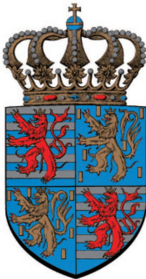
Petites armoiries de S.A.R. le Grand-Duc Henri de Luxembourg

Le tout est posé sur un manteau de pourpre, doublé d'hermine, bordé, frangé et lié d'or et sommé d'une couronne royale, les drapeaux dépassant le manteau.