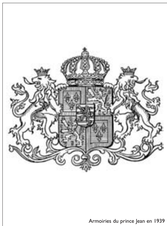
Armoiries du prince Jean en 1939

Écartelé aux I et IV d'azur à trois fleurs de lis d'or, posées 2,1, à la bordure de gueules (Bourbon-Parme) ; aux II et III d'azur semé de billettes d'or, au lion couronné d'or, armé et lampassé de gueules, brochant (Nassau) ; sur le tout en cœur un burelé d'argent et