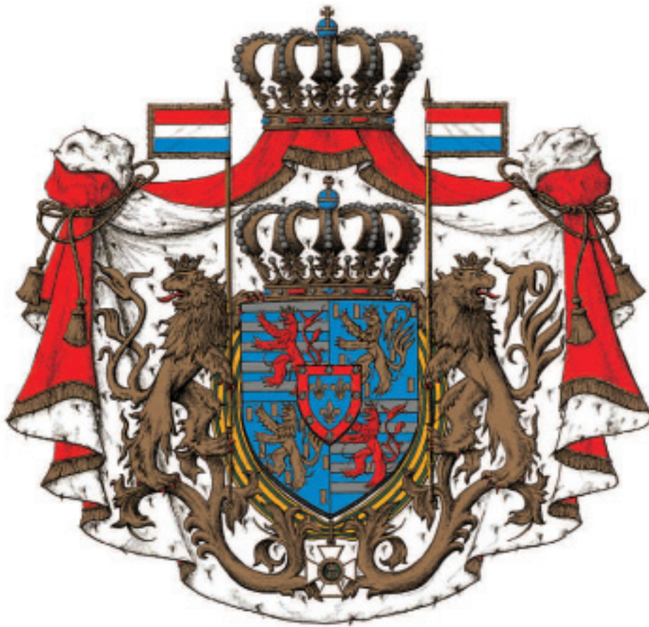
Grandes armoiries de S.A.R. le Grand-Duc Henri de Luxembourg

Ces nouvelles armes du Grand-Duc Henri nécessitent certaines explications :