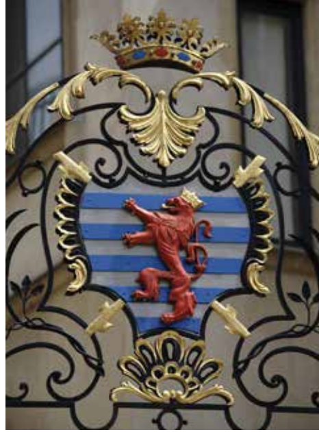
Büyük Dukalık Sarayı'nın arması

Arma 23 Haziran 1972 tarihli Devlet Amblemleri Yasası ile koruma altına alınmıştır, bu yasa 27 Temmuz 1993 tarihinde değiştirilmiş ve tamamlanmıştır.