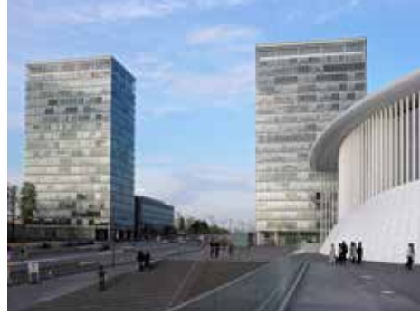
Kentin Kirchberg semti

Lüksemburg yurtdışına açılmanın başarılı bir örneği olarak görülür ve % 45,3'lük yabancı oranıyla Avrupa'nın küçük evreni (mikrokozmoz) sayılır. Küçüklüğü nedeniyle Lüksemburg "insani ölçülerde" bir ülke olma imajını korumuştur.