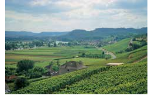
Mosel bölgesi: Nehir ve üzüm bağları