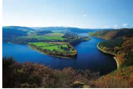
Yukarı Sûre Baraj Gölü

Ülkenin kuzeyi ve güneyi arasında az bir sıcaklık farkı vardır. Bu da yükseklik farkından kaynaklanır ve 2°C dolayındadır.