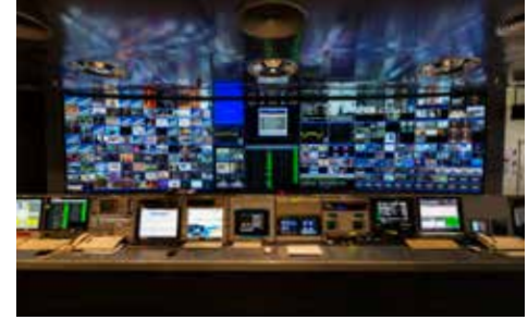
SES'in dijital şebeke operasyonları odası

Bu sektörün gelişmesini teşvik etmek için çok sayıda devlet destek programları üzerinden hükümetin proaktif politikasından görsel-işitsel üretim de yararlanmaktadır.