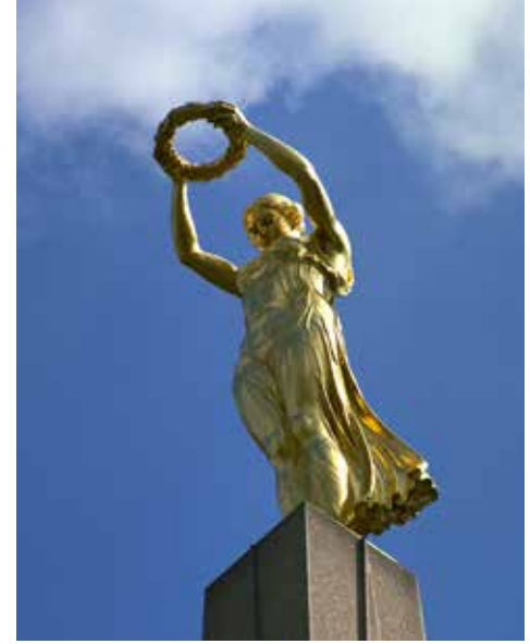
Lüksemburg halkının özgürlük ve direniş sembolü Gelle Fra

Ülkenin müttefik birliklerince 1944'te kurtarılmasından sonra Marshall Planı çerçevesinde modernleştirme ve altyapılandırma alanlarında kapsamlı çalışmalar gerçekleştirilmiştir.