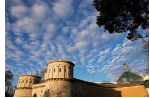
Arkasında Musée d'art moderne Grand-Duc Jean ile Musée Dräi Eechelen