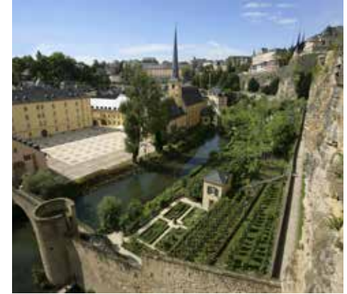
Kentin Grund semti

Londra Antlaşması'nda verilen güvencelere rağmen 1914'te Lüksemburg Alman birlikleri tarafından işgal edilmiştir. Ama işgal askeri alanla sınırlı kalmıştır. Lüksemburg devleti Alman askerlerinin girişini protesto etmiştir, fakat savaşı yürüten devletlere karşı kesin tarafsızlığına bağlı kalmıştır. Grandüşes Marie-Adélaïde ve hükümetin iktidarda kalması Birinci Dünya Savaşı'ndan sonra siyasi sonuçları beraberinde getirmiştir.