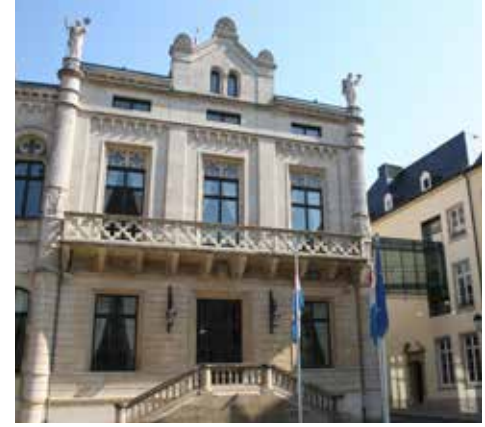
Ulusal meclis © Chambre des députés

Yasamaya ilişkin olarak ulusal meclise getirilmiş bütün yasa tasarıları ve yasa teklifleri için Ülke Konseyi'nden milletvekillerinin oylamasından önce görüş almak zorunludur. Yasalar oylama için meclise iki kere sunulur ve ikinci oylama en erken birinci oylamadan üç ay sonra yapılabilir. Eğer ulusal meclis Ülke Konseyi'nin muvafakatı ile bundan feragat ederse, bu arada olağan uygulama haline gelen ikinci oylama yapılmayabilir.