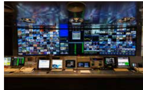
Sala sterowania siecią informatyczną w firmie SES

W związku z tym w Wielkim Księstwie, oprócz licznych małych i średnich przedsiębiorstw (MŚP), obecni są również międzynarodowi gracze gospodarki cyfrowej, tacy jak Amazon.com, eBay, PayPal, iTunes lub Vodafone. Potwierdzają oni tym samym pozycję Luksemburga jako niewrażliwego centrum dla przedsiębiorstw prowadzących