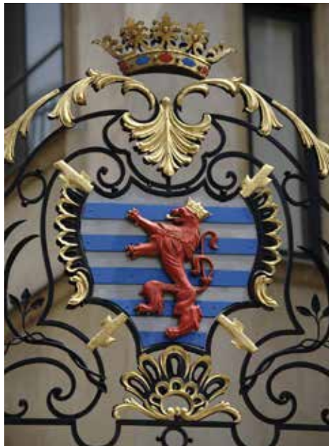
Godło na Pałacu Wielkksiążęcym

Godło jest chronione ustawą z 23 czerwca 1972 roku w sprawie emblematów narodowych, która została zmieniona i uzupełniona ustawą z 27 lipca 1993 roku.