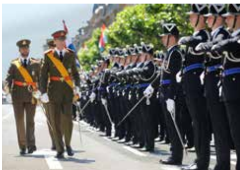
JKW Wielki Książę wraz z synem, dziedzicznym wielkim księciem, podczas święta narodowego

Formalnie Konstytucja nadaje Wielkiemu Księciu prawo swobodnego powoływania rządu, to znaczy tworzenia ministerstw, podziału departamentów ministerialnych i mianowania ministrów. W praktyce Wielki Książę dokonuje