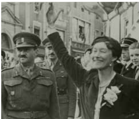
Wielka Księżna Charlotte w 1944 roku

Po dekonjunkturze gospodarczej bezpośrednio po wojnie nastąpił okres dobrobytu. Od 1929 roku