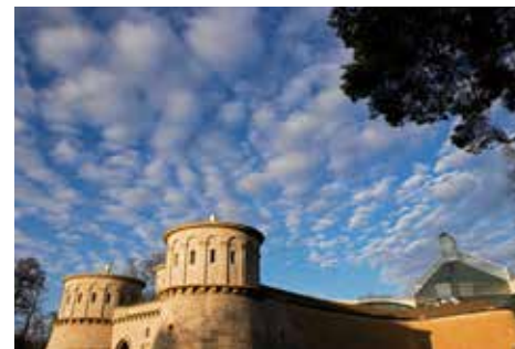
Muzeum Dräi Eechelen i Muzeum Sztuki Nowoczesnej im. Wielkiego Księcia Jana na drugim planie

W ramach przygotowania do roku 1995 i po jego zakończeniu powstały lub zostały odnowione liczne, równie prestiżowe co fascynujące, obiekty: Philharmonie (Filharmonia) zaprojektowana przez architekta Christiana de Portzamparc, Théâtre national du Luxembourg (Teatr Narodowy Luksemburga), Musée d'art moderne Grand-Duc Jean (Muzeum Sztuki Współczesnej im. Wielkiego Księcia Jana) stworzone przez Ieoh Ming Peia, Musée Dräi Eechelen (Muzeum Dräi Eechelen), Neimënster – Centre culturel de rencontre Abbaye de Neumünster (Neimënster – Kulturalne Centrum Spotkań w Opactwie Neumünster), Grand Théâtre de la Ville de Luxembourg (Teatr Wielki Miasta Luksemburga), Rockhal – Centre de musiques