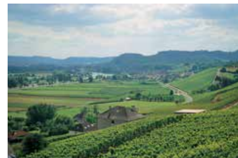
Region Mozeli: rzeka i winnice