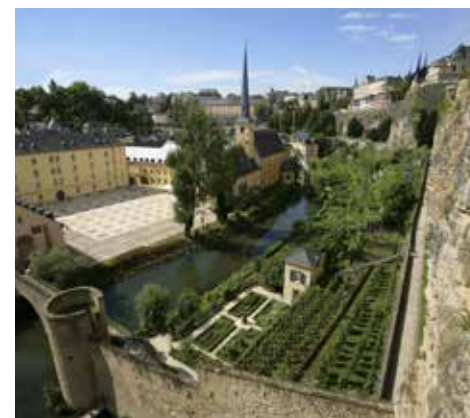
Dzielnica Grund

Gwarancje udzielone na mocy traktatu londyńskiego nie przeszkodziły oddziałom niemieckim w inwazji na Luksemburg w 1914 roku. Okupacja ograniczała się do sfery wojskowej. Władze luksemburskie protestowały przeciwko inwazji niemieckiej, zachowując jednak ścisłą neutralność wobec walczących. Wielka Księżna Maria-Adelajda i rząd pozostały na miejscu, co miało swoje konsekwencje polityczne po zakończeniu I wojny światowej.