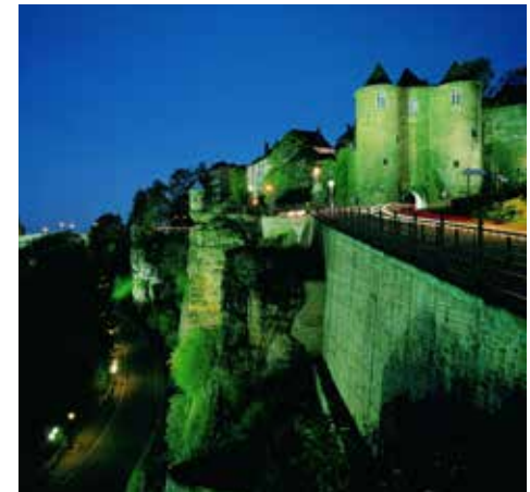
Anciennes fortifications de la capitale

L'effondrement de l'empire de Napoléon en 1815 a également des conséquences sur le statut du Luxembourg. Les grandes puissances européennes réunies au congrès de Vienne la même année décident de créer un grand royaume des Pays-Bas afin de contrecarrer d'éventuelles ambitions de la France. Élevé au rang de grand-duché, le Luxembourg est théoriquement autonome, mais lié par union personnelle à Guillaume I er d'Orange-Nassau, roi des Pays-Bas, grand-duc de Luxembourg. Parallèlement, l'adhésion à la Confédération germanique entraîne le stationnement d'une garnison prussienne au sein de la forteresse.