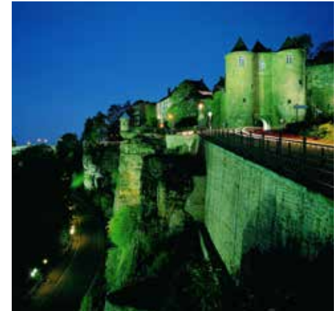
Antiguas fortificaciones de la capital

El desmoronamiento del Imperio napoleónico en 1815 repercutió también en el estatus de Luxemburgo. Las grandes potencias europeas, reunidas en el Congreso de Viena ese mismo año, decidieron crear un gran Reino de los Países Bajos, cuyo objeto era contrarrestar posibles ambiciones por parte de Francia. Elevado al rango de gran ducado, Luxemburgo era autónomo en teoría, aunque se hallaba personalmente unido