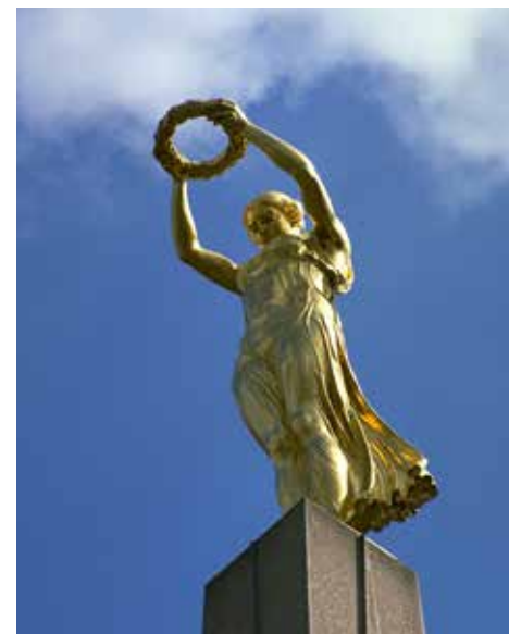
Gëlle Fra, símbolo de la libertad y de la resistencia del pueblo luxemburgués

La ocupación alemana supuso el fin de la independencia de Luxemburgo. La instauración de una administración civil alemana indicó la voluntad de los nazis de destruir las estructuras del Estado luxemburgués y de germanizar a la población. Un intenso esfuerzo propagandístico procuró fomentar la adhesión de los luxemburgueses al Reich. Desde 1942, los jóvenes luxemburgueses fueron obligados a alistarse en la Wehrmacht. La mayoría de la población dio muestras de una gran cohesión nacional. Como ocurrió en otros territorios ocupados, empezaron a formarse movimientos de resistencia, a los que el ocupante respondió con el terror y la deportación. Se calcula que las pérdidas humanas durante la Segunda Guerra Mundial fueron del 2% de la población total de Luxemburgo.