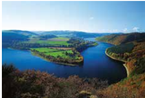
Lago del Haute-Sûre

La temperatura media anual se sitúa en 9,4 °C, variando entre -2,6 °C (valor mínimo medio) y 21,6 °C (valor máximo medio) (1981-2010).