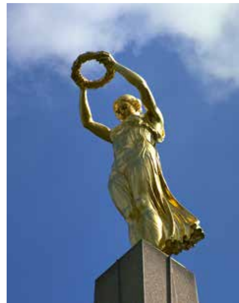
Die Gëlle Fra, Freiheits- und Widerstandssymbol des Luxemburger Volkes

Nach der Befreiung des Landes durch die alliierten Truppen im Jahr 1944 kam es im Rahmen des Marshall-Plans zu umfangreichen Anstrengungen zur Modernisierung und Schaffung von Infrastrukturen.