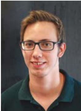
Pol Lutgen Vizepresident Informatioun