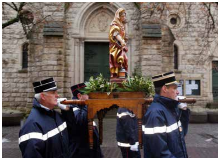
Bärbelendag dans le sud du pays

yeux, un nez et une bouche et on y plaçait une bougie. Ensuite, on y enfonçait un bâton avant de porter le tout à travers la localité. Bien sûr, à cette époque, personne n'imaginait que des chaînes de magasins profiteraient un jour de cette tradition pour vendre des masques en caoutchouc ou autres tenues de fantômes.