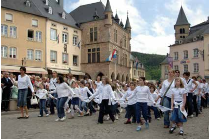
Sprangpressessioun à Echternach