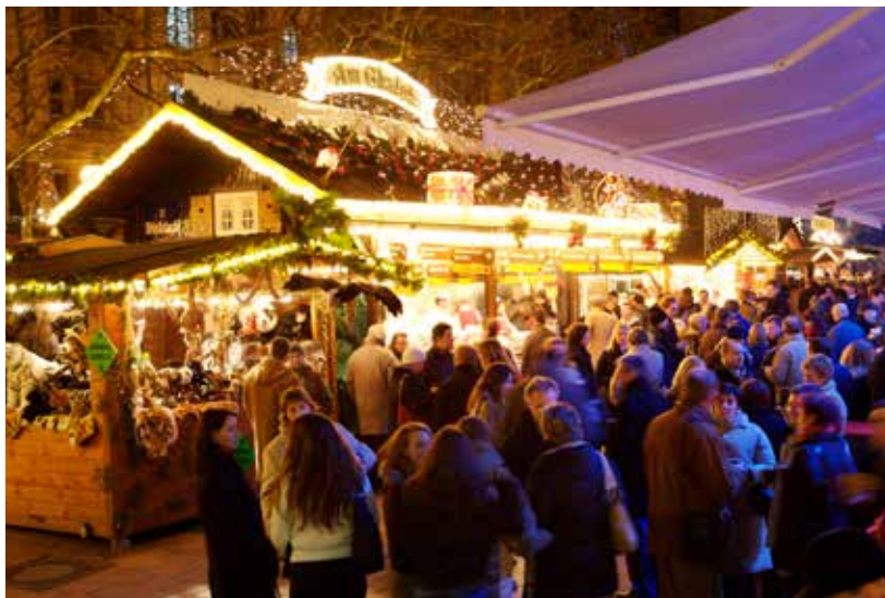
Chrëschtmaart avec chalets en bois

IV e siècle et se serait engagé en faveur des enfants, les petits Luxembourgeois font ce qu'on appelle de Schung setzen , c'est-à-dire que le soir, ils placent dans l'entrée leur chaussure ou leur pantoufle dans l'espoir que le Kleeschen (saint Nicolas) y dépose un petit présent. Toutefois, les enfants mal élevés, les élèves peu appliqués et ceux qui, au cours des mois précédents, n'ont pas toujours obéi à leurs parents doivent s'attendre à ce que le père Fouettard, que les Luxembourgeois appellent Housecker , les punisse en leur apportant une Rutt , un petit bâton en bois flexible.