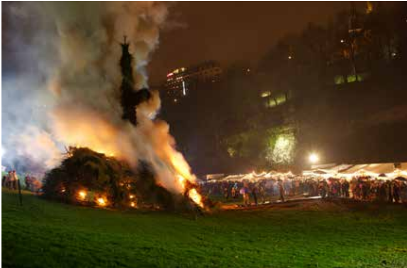
Buergbrennen dans la capitale