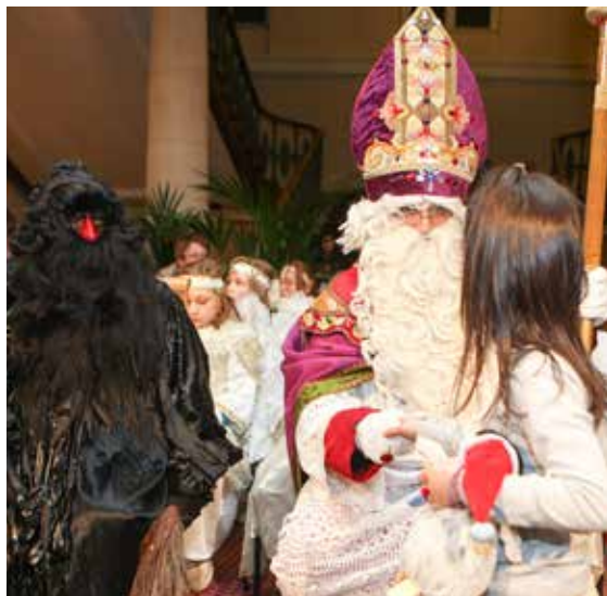
Kleeschen et Housecker