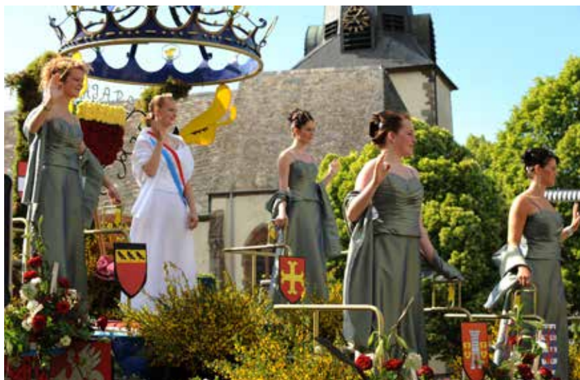
Geenzefest à Wiltz