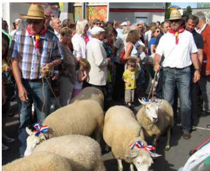
Ouverture de la Schueberfoer avec le Hämmelsmarsch