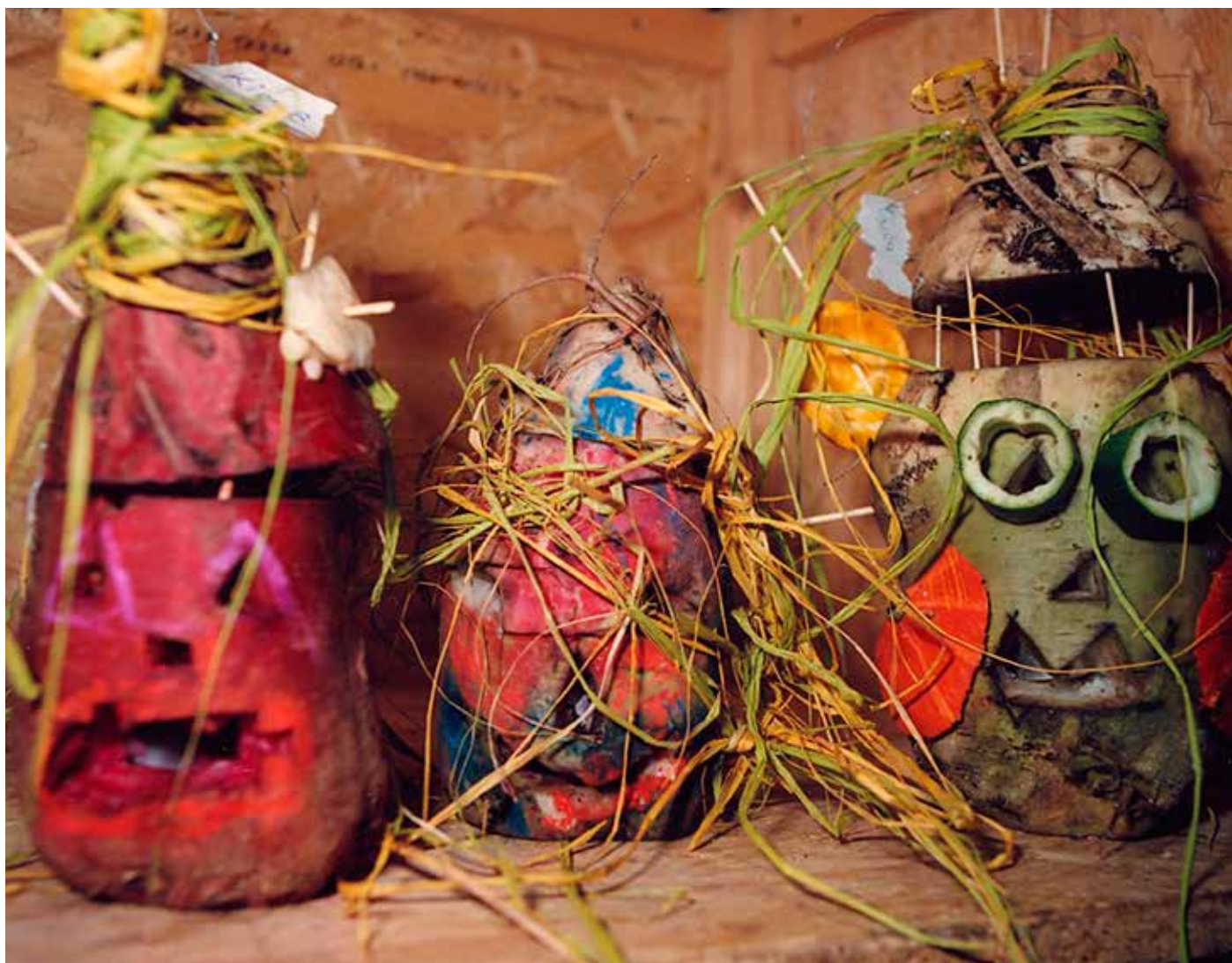
L'halloween luxembourgeois : d'Traulicht brennen