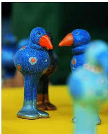
Péckvillercher à l'Éimaischen