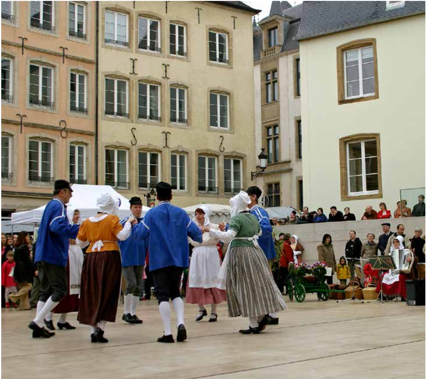
Groupe de danse folklorique à Luxembourg